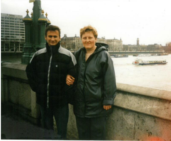
17.01.2002: V središču Londona pred prvim odhodom v bolnišnico