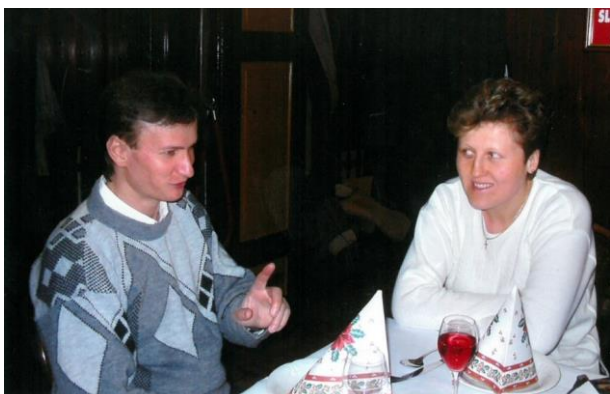
December 2002: Na društvenem prednovoletnem srečanju po vrnitvi iz Londona