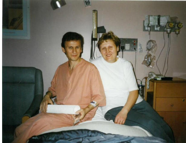
17.01.2002: Prvi dan v bolnišnici Royal Free v Londonu