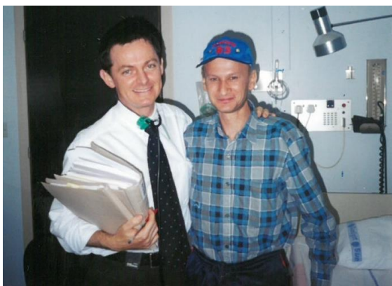
Robertov sobni zdravnik z njegovo dokumentacijo