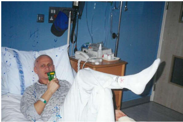
27.03.2002: Drugič v bolnišnici